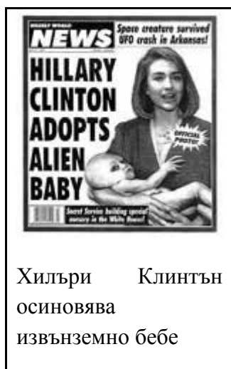
Хилъри Клинтън осиновява извънземно бебе

ФБР прави публични своите виждания за поведението на Адамски по начин който сериозно подкопал неговия авторитет. По време когато обществото вярвало безпрекословно в акуратността на изявленията правени от официалните власти, подобен негативен коментар можел да достатъчен за края на нечия кариера или да се изгуби напълно доверието в него. И много хора от масовата публика интересуващи се от феномена с лелящите чинии сега вярвали че Адамски е измамник. Това било особено в сила за тези, които били привърженици на научните разследвания свързани с лелящите чинии. Това, което обществото не разбирало било че разузнавателните агенции като ФБР и AFOSI имали за цел да развенчават контактъори като политика поради заплахата, която те представлявали за националната сигурност. Така контактъорите лесно можели да бъдат „натопени“ да вярват на нещо неформално споделено с тях от вътрешни хора и след това да бъдат упрекнати от други служители твърдящи че са направили измамни заявления при положение че не могат да потвърдят това, което им е казано.